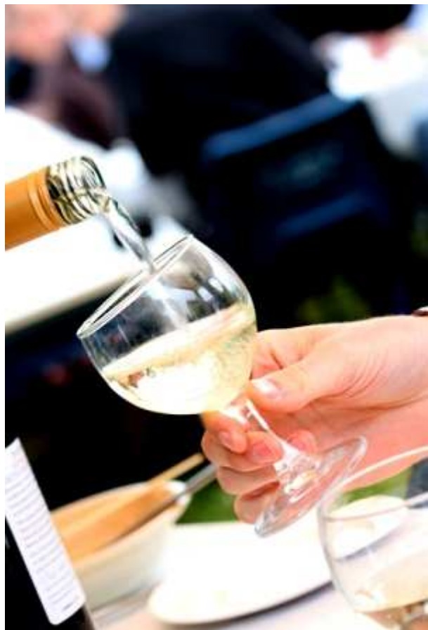
Csak egy pohárral?

A szeszesitalok az alkohol mellett kis mennyiségben úgynevezett kozmaolajokat (amilalkohol, kapronsav) is tartalmaznak, amelyek a részegítő hatás, illetve a másnaposság mértékét befolyásolják. Az alkohol tíz százaléka a gyomorból, a többi a vékonybélből szívódik fel. A zsírokban, fehérjében gazdag táplálék csökkenti a felszívódó alkohol mennyiségét, amelynek jelentős része a májban bomlik le, tizede a vesén és a tüdön keresztül változatlan formában távozik a szervezetből. A máj alkoholbontó képessége az elfogyasztott mennyiségtől függően megközelítőleg 0,15 ezrelék óránként.