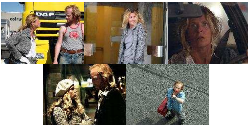
belga romantikus, vígjáték