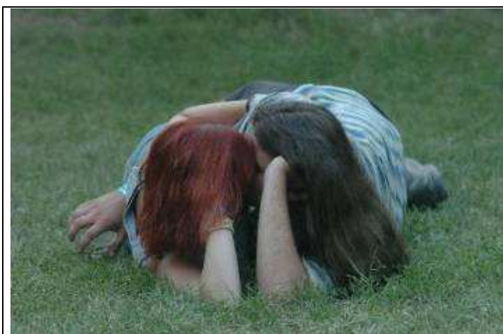
Függés a másiktól. Hagyományos szerepek, mai elvárások

A társfüggőség egyik legfontosabb jellemzője, hogy az érintett mindig másokra figyel, sosem magára, a mások szükségleteinek kielégítését tartja szem előtt, míg a sajátjait elhanyagolja. A kodependens ember folyamatosan retteg attól, hogy a számára fontos személy elhagyja, ezért partnere bármilyen negatív következményekkel járó viselkedését - például szenvedélybetegségét - tolerálja. Miközben túlzott felelősséget érez másokkal kapcsolatban, a saját érzéseiről tudomást sem vesz - ez a magyarázat interjúalanyunk viselkedésére is.