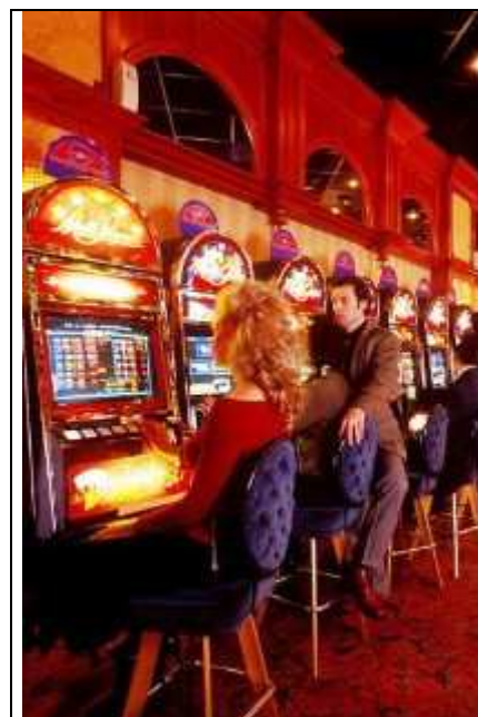
Szenvedélyes játék. Erkölcsi és morális leépülés?

A szenvedélyes játékosok többsége – az alkohol- és a drogfüggőséghez hasonlóan – férfi. „Ez leginkább azzal magyarázható, hogy a férfiak jóval teljesítményorientáltabbak, mint a nők, ráadásul a kudarc- és stressztűrő képességük is alacsonyabb” – árulta el Bolgár Judit pszichológus, egyetemi tanár.