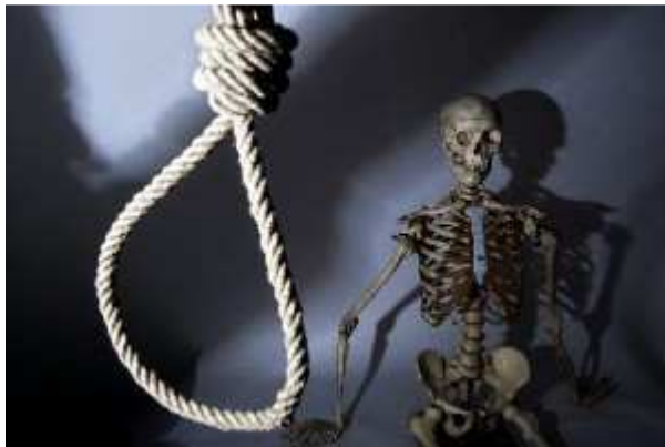
Életbevágó döntés. Nem éri meg

A fejlett országok közül Dél-Koreában és Japánban a legaggasztóbb a helyzet. Dél-Koreában a korábbi évekhez képest megkétszereződött a befejezett öngyilkosságok száma, százezer lakosra 2008-ban 24,8 eset jutott az Egészségügyi Világszervezet (WHO) adatai szerint. Japánban hasonlóan alakult az arány: ott tavaly százezer emberből 24 végzett magával. Pár hónapja a világsajtó beszámolt egy nagy port kavart japán esetről: a hokkaidói bíróság 100 millió jen kártérítést ítélt meg egy 33 éves férfi családjának, miután az munkahelyi túlhajszoltság miatt 2005-ben öngyilkosságot követett el. A férfi