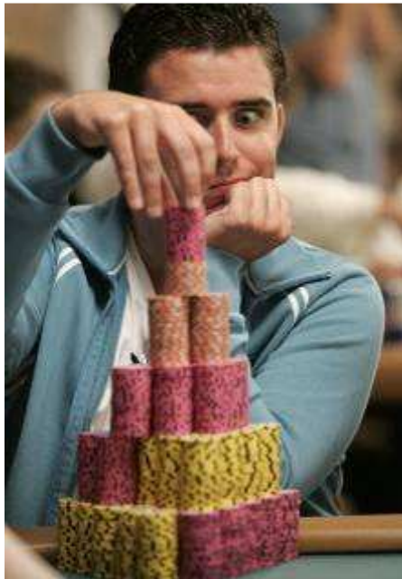
Transzállapotban? Kielégülés

Hogy miért kockáztatnak az emberek? Legtöbbször a gyors nyerési lehetőséget jelölik meg fő motivációnak, a szerencsejátékokra csábító reklámok pedig azt sugallják, hogy ehhez mindössze elég egyetlen esély, ami noha rendkívül csekély, pénzbe kerül. Ám jóval inkább arról van szó, hogy az egyetlen – de legalábbis a legfőbb – örömforrás az életükben, vagy éppen pótcselekvés.